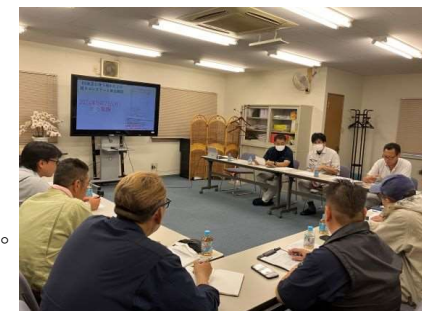
(写真は周知会の様子)

空調服、塩分、飲料の支給及び熱中症発生時の対応方法を各所に掲示し、意識向上と万が一の緊急対応の迅速化に努めました。